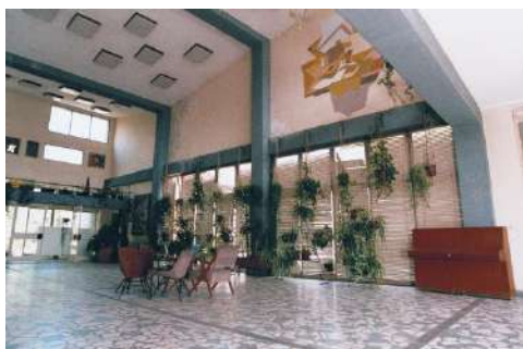
Слика 1.. Ентеријер матичне школе

Основна школа "Кадињача" (матична школа и издвојено одељење) ради у два објекта. Објекти се редовно одржавају и у добром су стању. Матична школа се налази у центру града, у непосредној близини предшколске установе "Бамби" и ниже Музичке школе. Окружена је пространим и добро одржаним парковима. Аутобуска и железничка станица се налазе у близини школе. Недалеко од школе су Градска библиотека и Дом културе "Вук Караџић". Издвојено одељење је удаљено око 2,5 km од матичне школе.