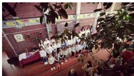
Слика 2. Ентеријер ИО

Основна школа "Кадињача" у Лозници организује редовну полудневну наставу у две смене у матичној школи и издвојеном одељењу. Смене се мењају месечно, јер се тако може најбоље организовати васпитно-образовни и други облици рада и због наставника који раде у другим школама.