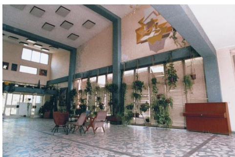
Слика 1.. Ентеријер матичне школе

Основна школа "Кадињача" (матична школа и издвојено одељење) ради у два објекта. Објекти се редовно одржавају и у добром су стању. Матична школа се налази у центру града, у непосредној близини предшколске установе "Бамби" и ниже Музичке школе. Окружена је пространим и добро одржаваним парковима. Аутобуска и железничка станица се налазе у близини школе. Недалеко од школе су Градска библиотека и Дом културе "Вук Караџић". Издвојено одељење је удаљено око 2,5 km од матичне школе.