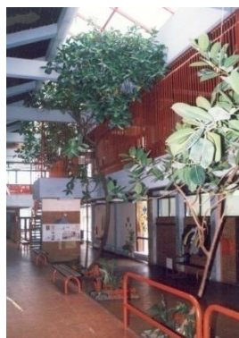
Слика 2. Ентеријер ИО

Основна школа "Кадињача" у Лозници организује редовну полудневну наставу у две смене у матичној школи. Смене се мењају месечно, јер се тако може најбоље организовати васпитно-образовни и други облици рада и због наставника који раде у другим школама. У издвојеном одељењу у Лозничком Пољу од ове школске године настава неће бити организована у две смене него ће ученици од првог до осмог разреда похађати наставу у првој смени током школске 2022/23. године. Овакав распоред рада је организован услед смањења броја одељења.