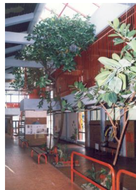
Слика 3. Ентеријер ИО

На темељима традиције, остварених резултата и успеха ученика и наставника који су радили са њима школа гради савремену оријентацију, руководећи се принципима модернизације наставе, подстицања личног развоја ученика, наставника, родитеља и њиховог активног учешћа у раду школе. Школа тежи да однегује амбијент у коме ће се ученици правилно развијати, добро осећати и квалитетно учити.