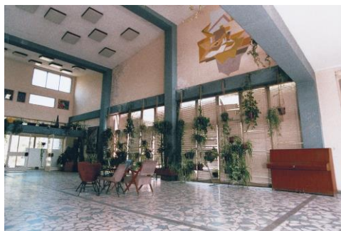
Слика 2.. Ентеријер матичне школе

Матична школа се налази у центру града, у непосредној близини предшколске установе "Бамби" и ниже Музичке школе. Окружена је пространим и добро одржаваним парковима. Аутобуска и железничка станица се налазе у близини школе. Недалеко од школе су Градска библиотека и Дом културе "Вук Карацић". Издвојено одељење је удаљено око 2 km од матичне школе.