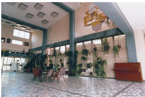
Слика 1.. Ентеријер матичне школе

Основна школа "Кадињача" (матична школа и издвојено одељење) ради у два објекта. Објекти се редовно одржавају и у добром су стању. Матична школа се налази у центру града, у непосредној близини предшколске установе "Бамби" и ниже Музичке школе. Окружена је пространим и добро одржаваним парковима. Аутобуска и железничка станица се налазе у близини школе. Недалеко од школе су Градска библиотека и Дом културе "Вук Караџић". Издвојено одељење је удаљено око 2,5 km од матичне школе.