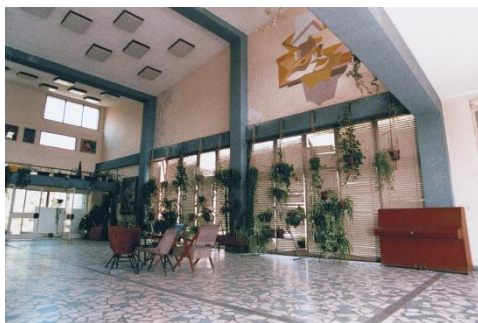
Слика 2. Ентеријер матичне школе

Матична школа се налази у центру града, у непосредној близини предшколске установе "Бамби" и ниже Музичке школе. Окружена је пространим и добро одржаваним парковима. Аутобуска и железничка станица се налазе у близини школе. Недалеко од школе су Градска библиотека и Дом културе "Вук Караџић". Издвојено одељење је удаљено око 2 km од матичне школе.