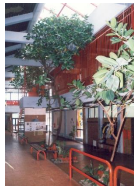
Слика 3. Ентеријер ИО

На темељима традиције, остварених резултата и успеха ученика и наставника који су радили са њима школа гради савремену оријентацију, руководећи се принципима модернизације наставе, подстицања личног развоја ученика, наставника, родитеља и њиховог активног учешћа у раду школе. Школа тежи да однегује амбијент у коме ће се ученици правилно развијати, добро осећати и квалитетно учити.